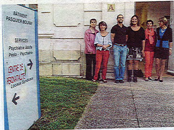
Toute l'équipe devant l'entrée du centre de périnatalité flambant neuf.

Centre de périnatalité, ouvert du lundi au vendredi, de 9 h à 17 h (un lundi par mois, consultations jusqu'à 20 h). Tél. 02.47.91.31.24.